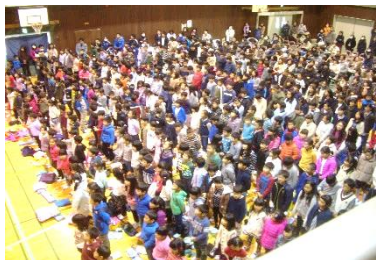
写真上左：4年生 発表『世界の国を発表しよう!!』 写真上中：5年生 群読・合奏・合唱『ONE PIECE』 写真上右：6年生 発表・合唱『平和を築くために』 写真下：全体合唱『Believe』