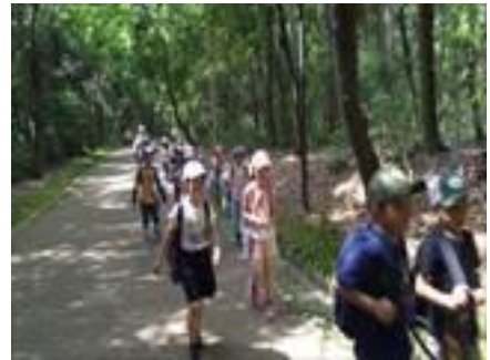
3年 京都府立植物園