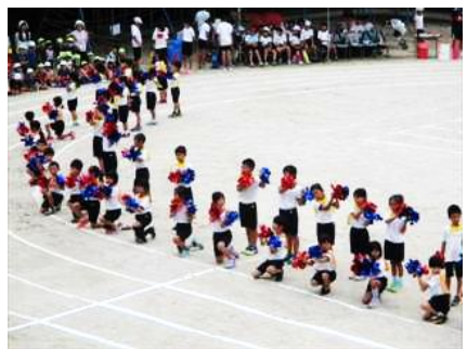
3・4年 「一小 花がさ」