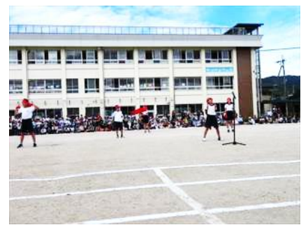
1・2年 「Go My Way」